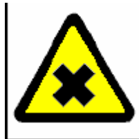
Sostanze nocive o irritanti