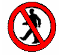
Vietato ai pedoni