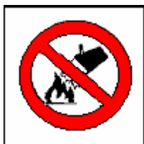
Divieto di spegnere