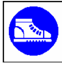
Calzature di sicurezza obbligatorie