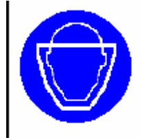
Protezione del viso obbligatoria