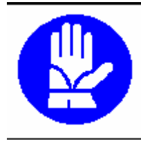
Guanti di protezione obbligatori