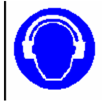
Protezione obbligatoria dell'udito