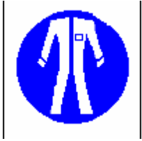
Protezione del corpo Obbligatoria