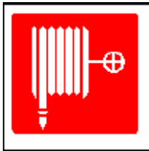
Lancia antincendio emergenza

(il rosso deve coprire almeno il 50 % della superficie del cartello)