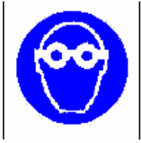
Protezione obbligatoria degli occhi