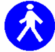
Passaggio obbligatorio per i pedoni