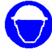
Casco di protezione obbligatorio