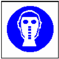
Protezione delle vie respiratorie obbligatoria