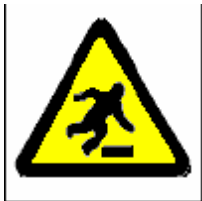
Pericolo di inciampo