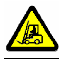
Carrelli in movimento